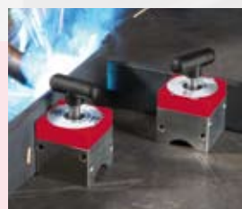
Mag-SQ 68 Siła odrywania 68 kg

Mag-SQ 450 Art. nr 4932352568 Kod EAN 4002395372263