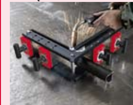
Przytrzymuje elementy płaskie i rury