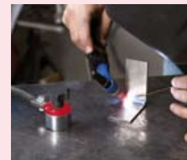
Mag-GC 300 pojemność 300 A