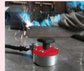
Mag-GC 600 pojemność 600 A